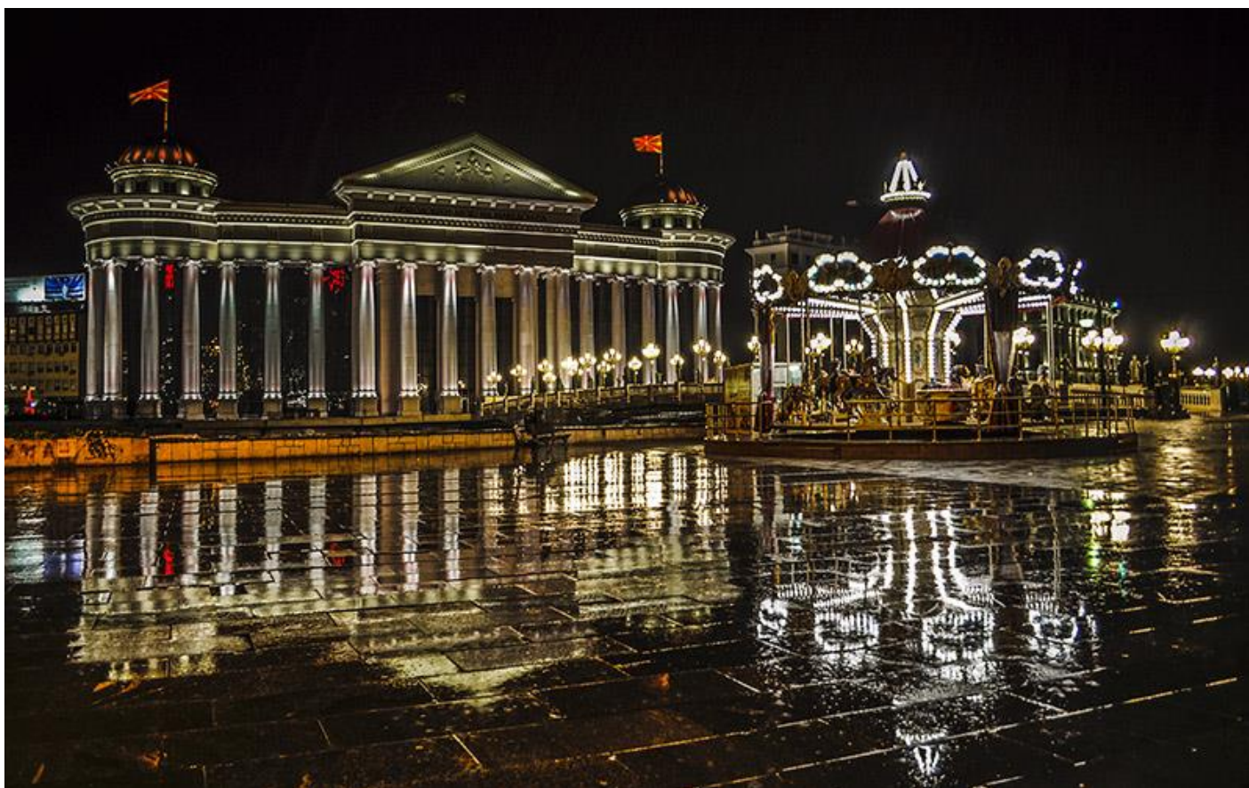
Skopje 's nachts, na een regenbui

Met de regionale conferentie van de IARF Regio Europa en het Midden Oosten (EME) in Macedonië in het vooruitzicht, lag het voor de hand dat enkele leden van het EME bestuur een bezoek aan dat land zouden brengen. Een goede aanleiding was er omdat IARF uitgenodigd was voor de ceremonie van de opening van het nieuwe gebouw van de Bektashi in Albanië. Door via Kosovo te reizen konden we ook nog een bezoek aan de Tekke (Bektashi klooster) in Gjakova brengen. Over het lidmaatschap van de Macedonische afdeling van de Bektashi (Soefi) orde verscheen al een stuk in de IARF Nieuwsbrief 49 van mei 2015.