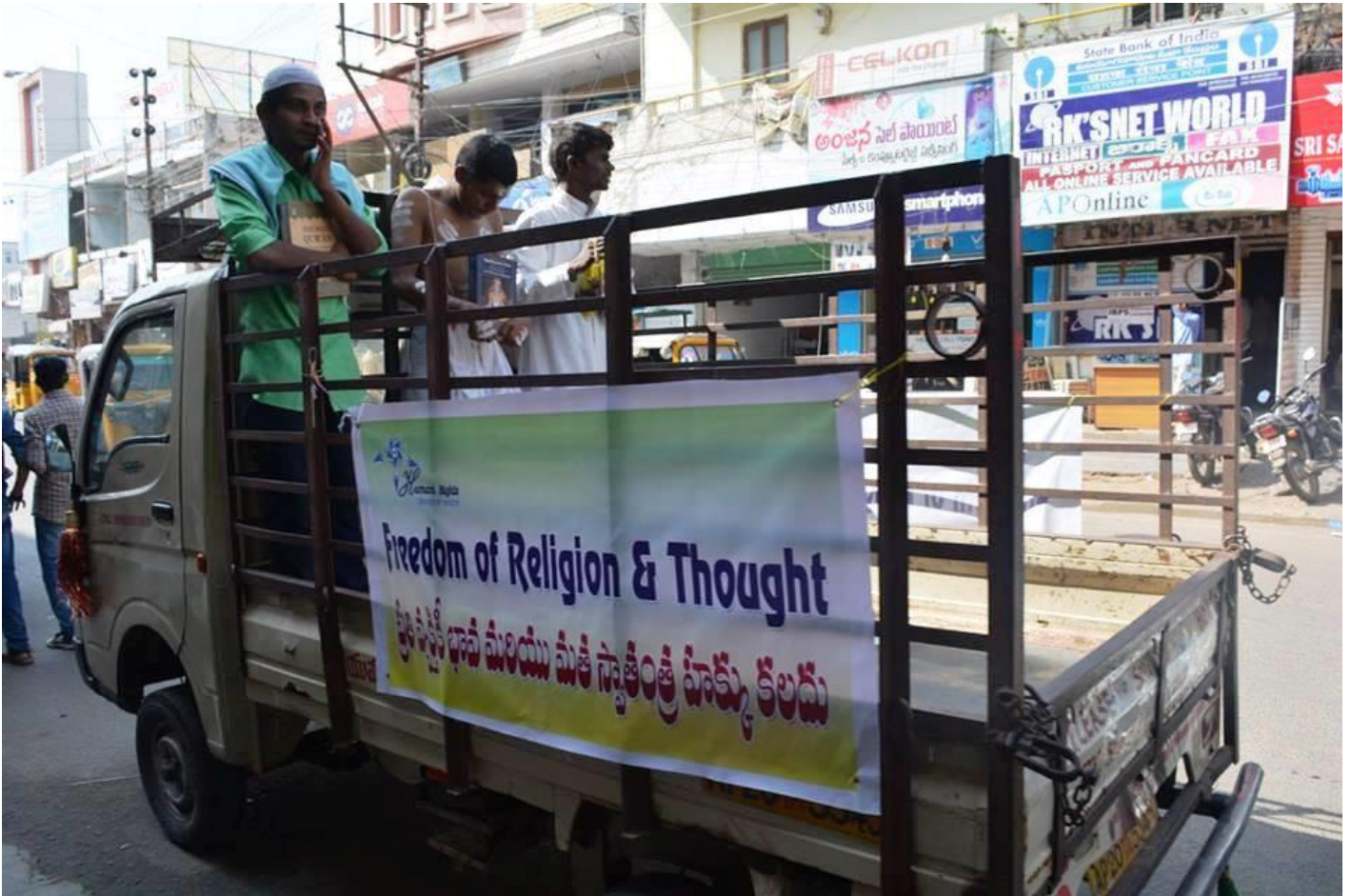
Mensenrechteneducatie in India